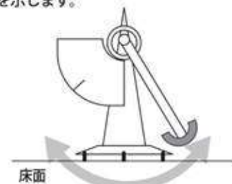
*振り子式滑り抵抗試験*

一般に道路面の滑りやすさを測定する 方法として「振り子式滑り抵抗試験」が あり、BPNという数値で表されます。 数値が大きくなるほど滑りにくい状態 を示します。