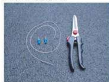
針がね、がびょう、万能バサミ