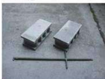
ブロック、専用パール