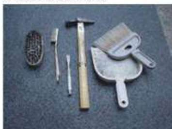
ワイヤーブラシ、金槌、たがね、