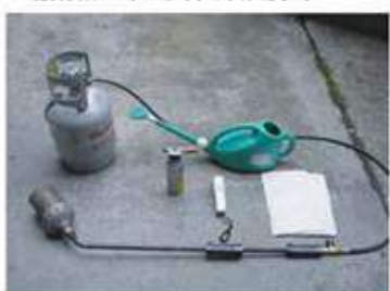
ガスバーナー、温度計、ジョウロ、水、ぞうきん

※温度計は貼り付け面の表面温度が測定できるものをご使用ください(赤外線温度計など)。